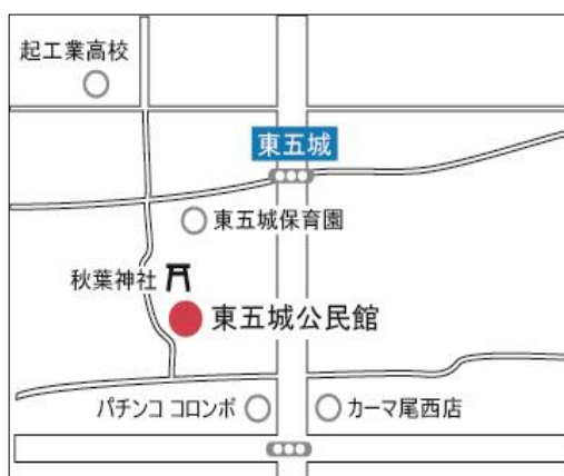
▼東五城公民館地図